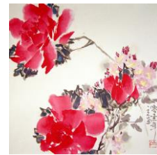
Œuvres de He Yifu