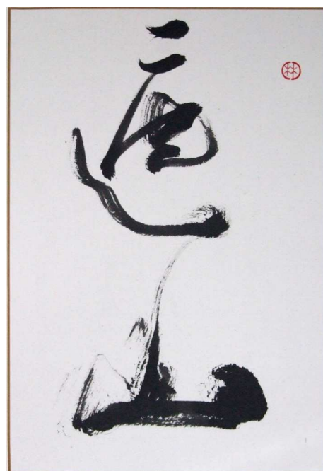
Catherine Denis Recouvrir la montagne