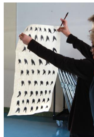
« Choisir les traits et les points qui vous semblent le mieux refléter l'élégance et la fragilité de l'orchidée »