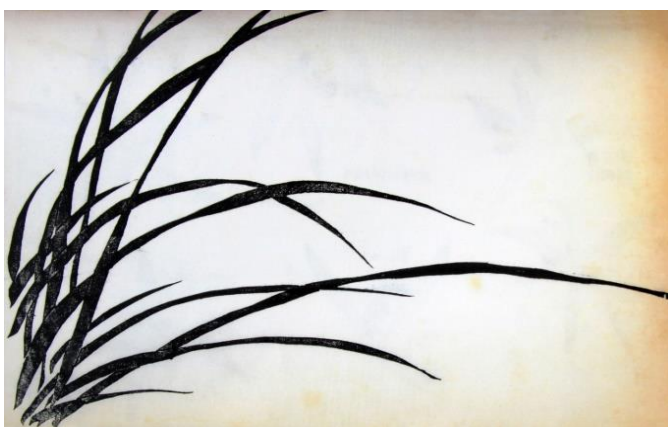
« La calligraphie, c'est l'art d'un geste dans l'espace qui rencontre de temps en temps le papier »