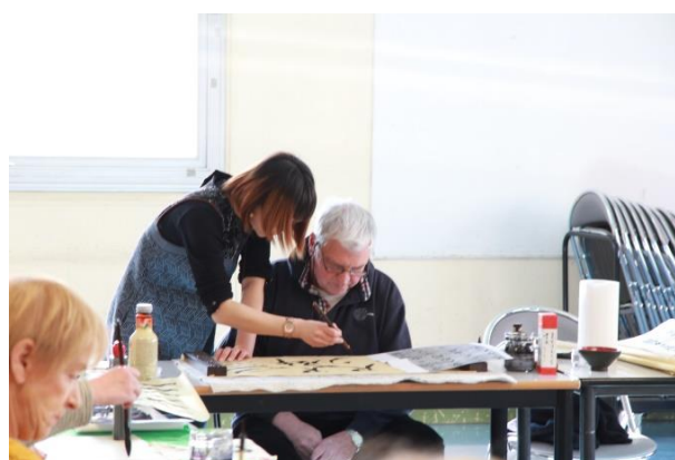
« Le trait est une entité faite d'os, de chair, de tendon et de sang. Le sang donne la température de l'émotion »